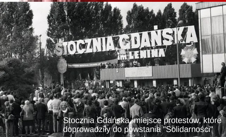
Stocznia Gdańska, miejsce protestów, które doprowadziły do powstania "Solidarności"